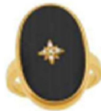
Chevalière. 26 €, Le Mariage à Bijoux E. Leclerc