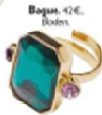
Bague. 42 €, Bodet