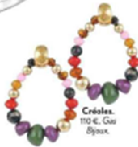
Créoles. 110 €, Guy Bijoux