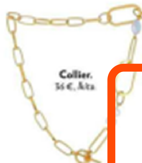
Collier. 35 €, À la