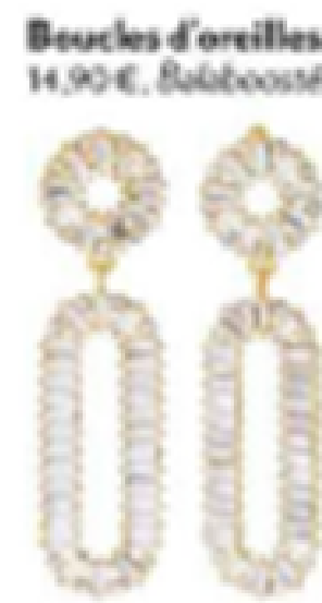
Boucles d'oreilles. 14,90 €, BalabooSté