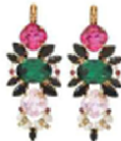
Dorineuses. 110 €, Santillon

Mules. 50,99 €, Asoc Ballarinas. 135 €, JB Martin