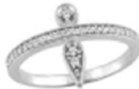
Bague. 79 €, Monet Paris