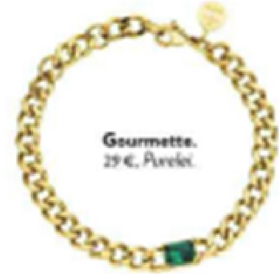
Gourmets. 29 €, Paréol