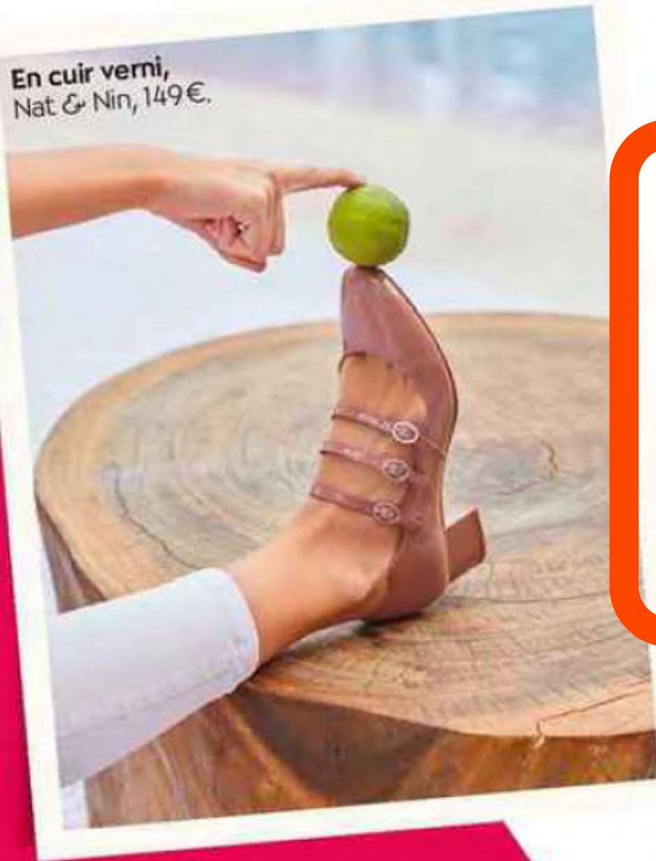
En cuir verni, Nat & Nin, 149€.