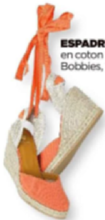
ESPADRILLES en coton et corde, Bobbies, 125 €.