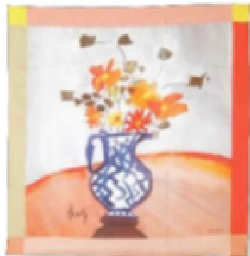
FOULARD en soie, Malfroy x Thanh Thuy, 55 €.