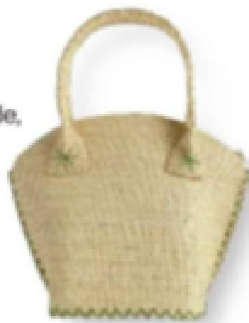
PETIT SAC en raphia, Taillée Paris, 160 €.