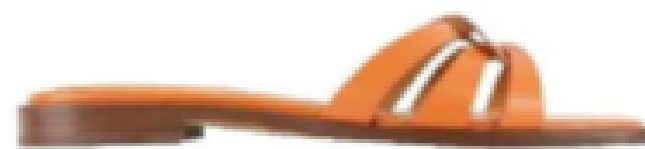
Mandarine. 140 €, Bobbies.