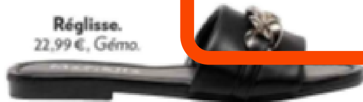
Réglisse. 22,99 €, Gémo.