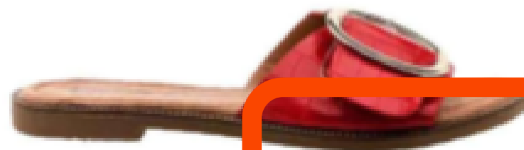
Cerise. 24,99 €, Besson.

Tressées, à boucles ou ajourées, les claquettes en cuir s'enfilent pour upgrader son style en un clin d'œil.