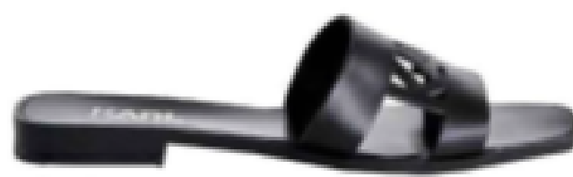
Charbon. 99,95 €, Karl Lagerfeld sur Sarenza.