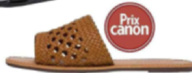
Caramel. 14,95 €, Tissaia.