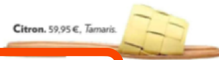
Citron. 59,95 €, Tamaris.